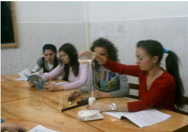
Laborator de Industrie alimentară