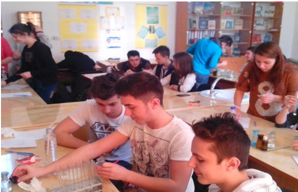
Laborator de Chimie