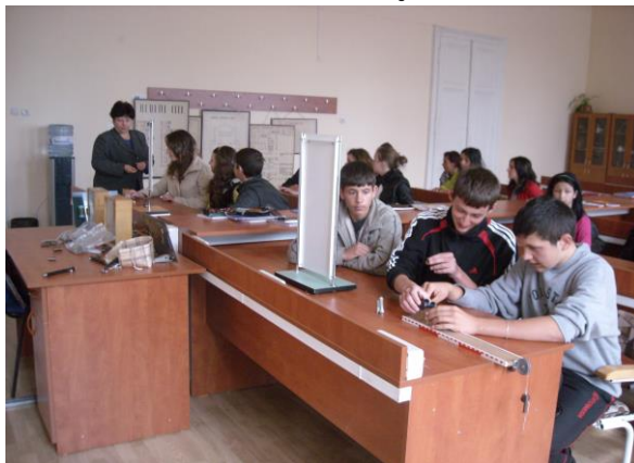
Laborator de Fizică