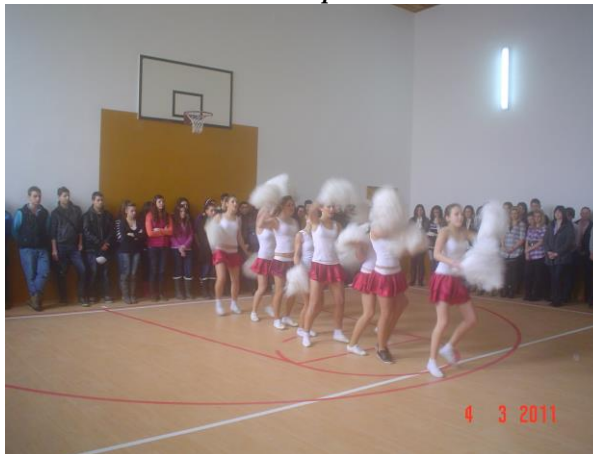
Sala de sport