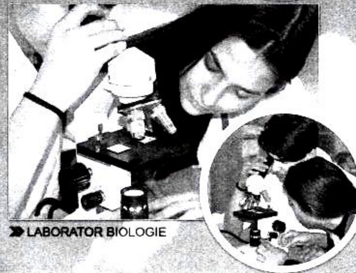
» LABORATOR BIOLOGIE