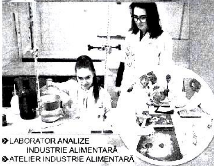
» LABORATOR ANALIZE INDUSTRIE ALIMENTARĂ » ATELIER INDUSTRIE ALIMENTARĂ