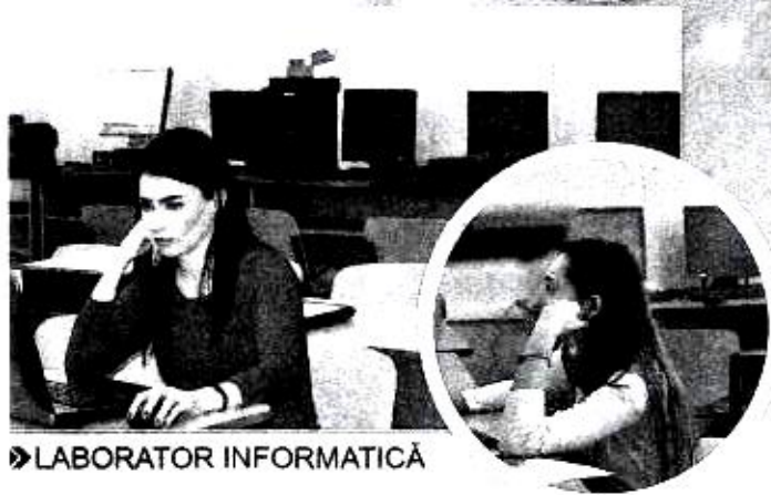
» LABORATOR INFORMATICĂ