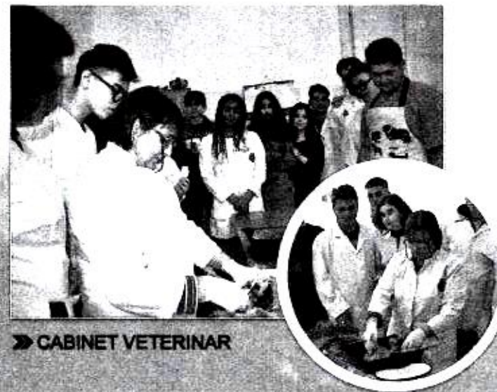
» CABINET VETERINAR