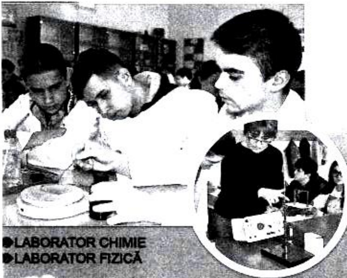
» LABORATOR CHIMIE » LABORATOR FIZICĂ